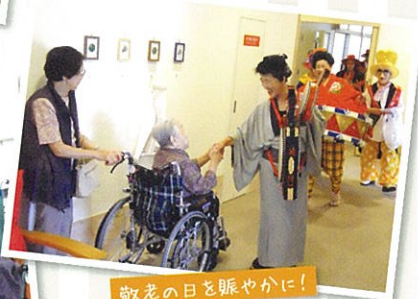
敬老の日を賑やかに!