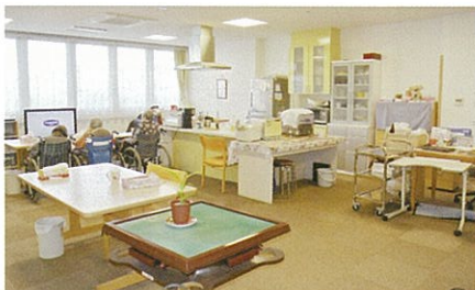
リビング(各ユニット) / 入居者が互いに思いやり ながら、時間を共有できる生活スペースです。