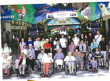
家族も一緒に遠足へ