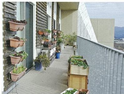
バリアフリーで広々としたベランダ。外気浴や植物栽培を楽しめます。外壁にはプランターも設置いただけます。