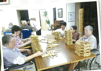
イメージ豊かにカプラブロックを積みます