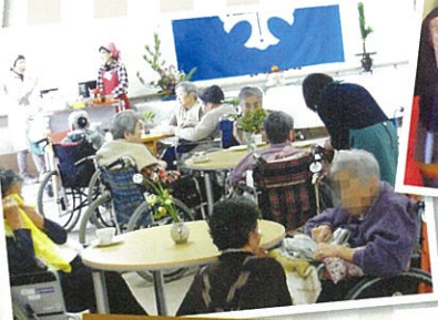
ボランティアの方による喫茶コーナー