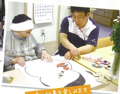
四季の行事を楽しみます