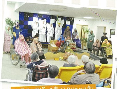
入居者と職員が演じるクリスマス劇