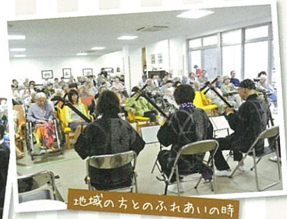
地域の方とのふれあいの時