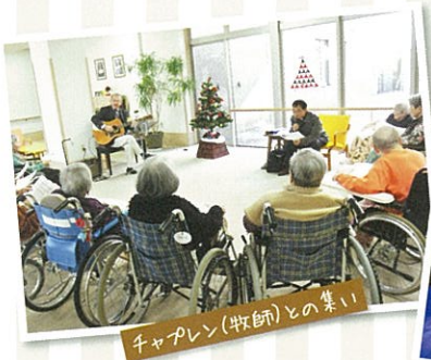
チャプレン(牧師)との集い

地域に開かれた愛の園では、ここを拠点に地域の方々や子供たちとの交流行事を開催しています。遠足、敬老の日、クリスマスなど、シーズンに合わせて多彩な行事を実施しており、入園者は生き生きとした表情で素敵な時間を過ごしています。また介護職員、看護職員、機能訓練指導員など、いずれも各専門分野の高い技術と豊かな経験を身に付けた充実のスタッフがサービスにあたります。