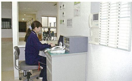
介護ステーション(各階) / 昼間はフロア担当看護職員、夜間は介護職員の詰所となります。