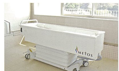
特殊浴室(1室) / バッテリー駆動で移動可能な横臥位浴槽です。介護の流れに合わせて場所や向きを変えられます。