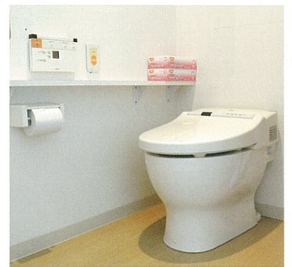
全自動のため快適・便利に利用できます。安心のナースコールも備えています。