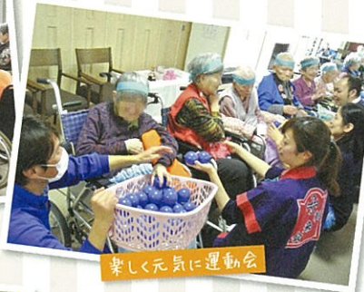
楽しく元気に運動会