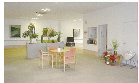
エントランスホール(1階) / 訪問者をお迎える 空間は明るく広々と。