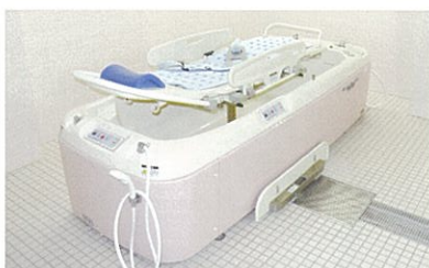
特殊浴室(2室) / 最新の機器を完備した浴室(横臥位浴)のため、安心して入浴していただけます。