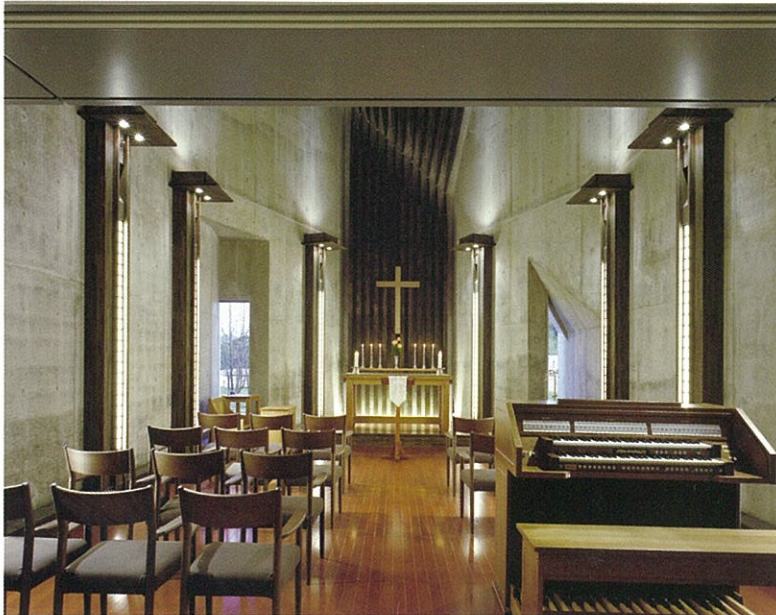
チャペル(1階) / 黙想や祈りの場としてお使いいただけるチャペル。毎日曜日に礼拝を行っており、自由に参加していただけます。