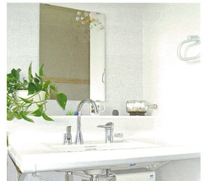
いつでもお湯の使える洗面台は車椅子でも使用可能です。