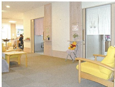
個室前のスペースも広々と、ゆったり感を漂わせます。