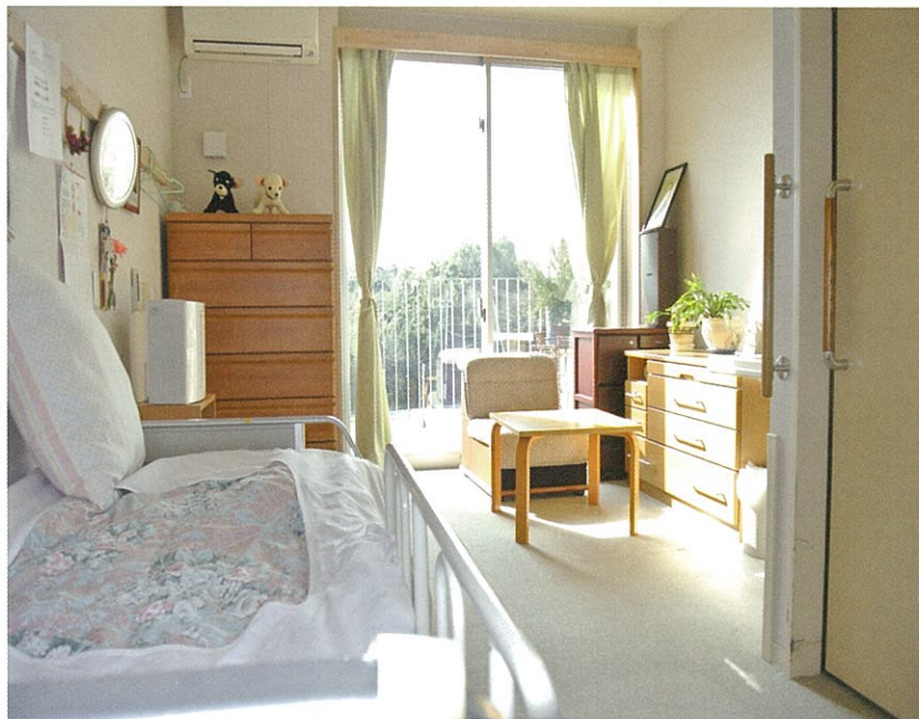
個室(8.3畳、トイレ・ベランダ含まず)はすべてエアコンを完備。愛用されている家具などを自由に持ち込むことも可能で、居心地よく過ごしていただけます。