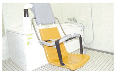
個人浴室(7室) / リフト付き浴槽(座位浴)を完備。お一人ずつゆったりご利用いただけます。