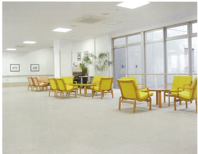
地域交流スペース(1階) / 入居者のユニットを越えた集いの場や、ボランティアの方の アトラクションの場に。また地域の方も利用できるコミュニケーションの場となっています。