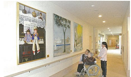
廊下 / 館内すべてが「愛の園ギャラリー」。たくさん の作品に心が安らぎます。