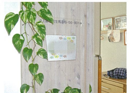
各個室ごとに住所表示と自分の好きな表札をかけて、自分の家であることを意識していただけます。