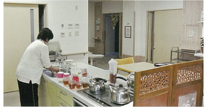
キッチンも備えた食堂のあるリビングは、日常生活の大切なスペース。家庭環境を継続しながら、人と人の絆を感じられる場ともなっています。

こうしたケアサービスを、90名の入園者に対して安心の24時間体制で実施しています。またショートステイサービス(定員20名)もご利用いただけます。